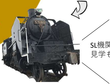
SL機関車の 見学もできます!

SL広場には本物の機関車が展示されています。 中に入って運転席も見学してみよう。